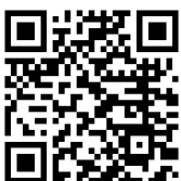
Bo De wel