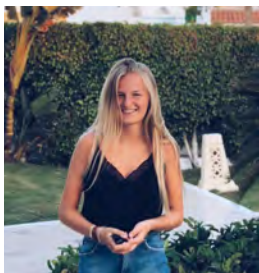
Bo De wel