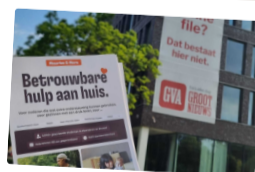
Betrouwbare hulp aan huis

Klant beoordeelt de student op menselijke klik én uitvoering — UX-prototype op de feature-branch, gedemonstreerd via Loom.